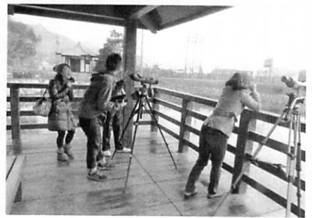
▲ 2 月、3 月は渡り鳥の交替期。「弓削野鳥の会」の月例鳥見会に飛び入り参加した移住予定者達

09 年 6 月議会で条例可決、10 月より施行の運びとなりました。合併 3 期目の我が町議会では、自治体の基本である全町 1 区制選挙と、議会基本条例の制定を当初より目指しています。選挙区に關しては魚島特区を設けるよう魚島地区や、首長から意見が出されたのも事実ですが、合併 10 年を経たなお合理性を欠く、そのような特別扱いが求められ、それがなされるなら、この町の政治感覚は正常とは言えないでしょう。 ■議会運営委員会で素案作り 去る 1 月 28 日の議員協議会で、議会基本条例の素案づくりは議会運営委員会 (議運) で行うことと決しました。 またたき台をつくり、議運で練り、素案が出来た時点で理事者を交えての検討を加え、素案について町民の皆さんのご意見を伺い、それに基づき修正するべきものは修正して案とし、来年 3 月議会には提案できるようにしたいと考えています。